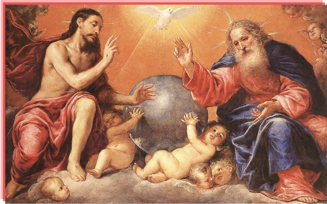
The Holy Trinity (1643) by Antonio de PEREDA (1611-1678)